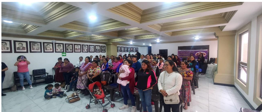
ATENCIÓN Y CAPACITACION A MUJERES