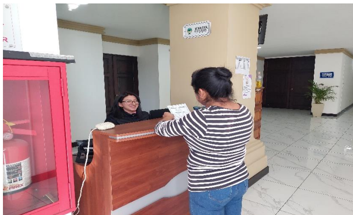
ATENCIÓN A VECINOS