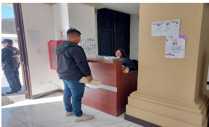
ATENCIÓN A USUARIOS